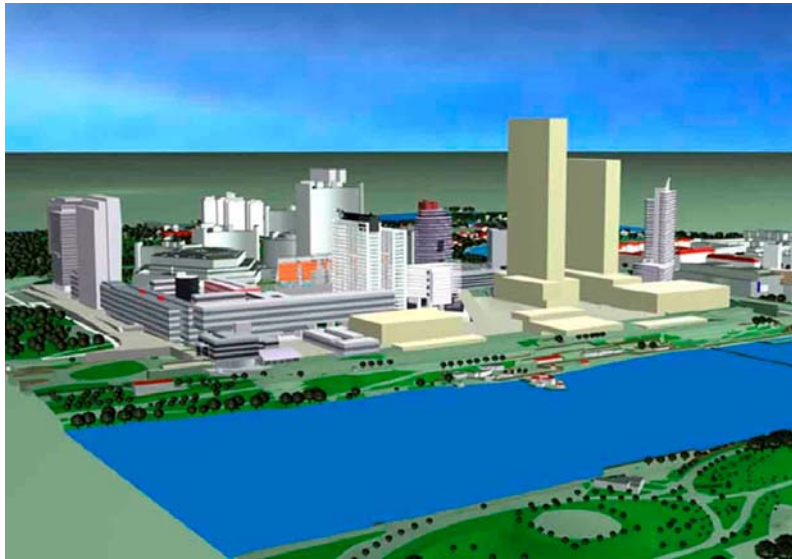
Donau City auf der Donau Platte samt neu geplanten Hochhäusern von D. Perrault.

Industriestädten, geprägt von 'unterirdischen' Schnellstrassen. Die Office-Bauten mit Ausblick wurden im Stück verkauft, obwohl die klassischen Büroflächenstandorte Wiens eine beachtliche Leerstandsrate aufweisen.