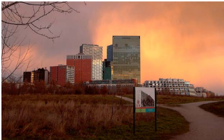
Wienerberg City im Süden Wiens, besteht aus u.a. Bürozwillingstürmen von M. Fuksas, zwei Wohntürmen von Coop Himmelb(l)au, einer von Delugan_Meissl sowie einer von A. Wimmer, drei Riegel von Coop Himmelb(l)au und dem Atelier 4, einer Schule und einem Riegel von C. Brullmann.

Die Bebauungsprojekte der letzten Jahre wie Wienerberg City samt Twin Towers und Businesspark auf dem ehemaligen Betriebsareal der Ziegelwerke Wienerberger und Monte Laa auf den ehemaligen Lagerflächen der Porr werden durch weitere Projekte des PPP-Modells, wie dem Zentralbahnhof auf dem Areal des Südbahnhofs oder Siemens City auf dem Siemens-Areal fortgesetzt.