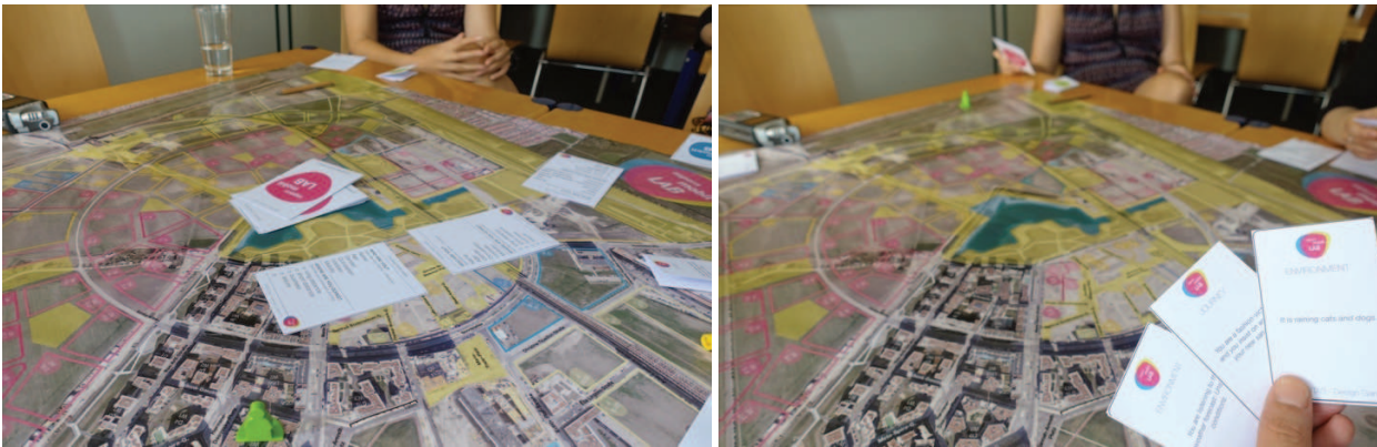
Abbildung 2: Beispiele für Design Games im Projekt REBUTAS.

Die Abbildung 2 zeigt das Design Game Beispiel, das im Projekt REBUTAS generiert und eingesetzt worden ist.